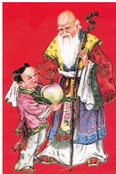
&lt; Hình 4: Tranh Thọ tinh và tiểu đồng bưng trái đào

Một tay Thọ tinh cầm gậy, sẵn sài những mắt gỗ, có lẽ làm từ rễ cây của một cổ thụ đã sống rất nhiều năm; tay kia Thọ tinh cầm quả đào. Có khi Thọ tinh chỉ cầm một trong hai món này.