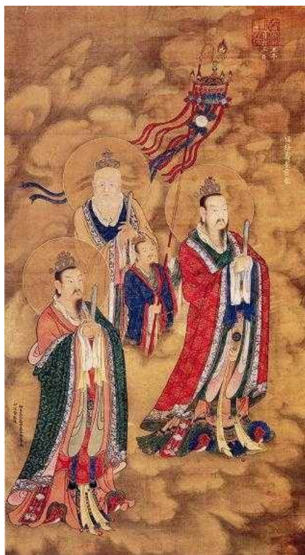
&lt; Hình 3: Tam tinh

Theo truyền thuyết Thọ tinh ngự tại Nam cực, do đó Thọ tinh còn có danh hiệu là Nam cực tiên ông hay Nam cực Thọ tinh hay Nam tào . Đây là ông tiên chuyên giữ bộ sinh (coi về tuổi thọ con người). Đối lập với Thọ tinh (Nam tào) là Bắc đẩu , chuyên giữ bộ tử (coi về tuổi chết con người). Nam tào Bắc đẩu vì thế là một cụm từ thường đi kèm với nhau. Theo nhiều truyện cổ, hai ông tiên này hay ra thạch bàn đánh cờ với