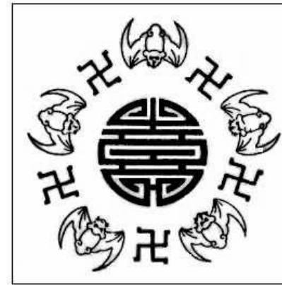
< Hình 2: Chữ thọ, năm con dơi, năm chữ vạn

Chữ thọ cách điệu thành hình tròn còn được kết hợp với một vòng tròn bao quanh gồm năm con dơi và năm chữ vạn (swastika) xen kẽ nhau.