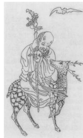
Hình 6: Thọ tinh cỡi hươu

Đôi khi tranh vẽ Thọ tinh cỡi trên lưng hay đứng bên cạnh một con hươu sao hoặc con nai. Hươu hay nai chữ Hán gọi là lộc , đọc cùng âm [lù] với chữ lộc theo nghĩa bổng lộc, tài lộc, lợi lộc... Có khi vẽ con hươu miệng ngậm vài nhánh cỏ linh chi để liên hệ thêm ý nghĩa trường sinh. Thọ (sống lâu) đọc cùng âm [shòu] với chữ thọ , thụ theo nghĩa thọ nhận, nhận được.